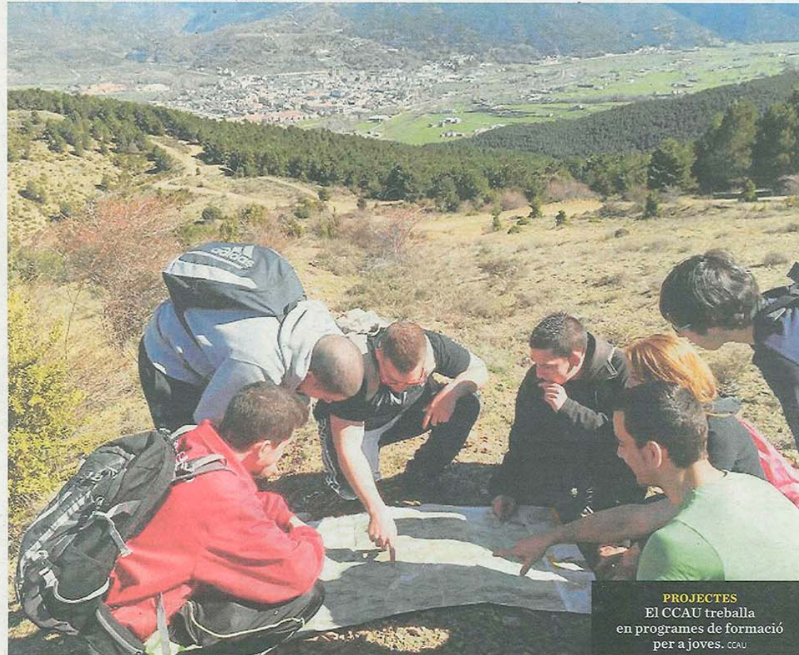
PROJECTES El CCAU treballa en programes de formació per a joves. CCAU

En aquesta línia de treballar per a la preservació de la sostenibilitat i la qualitat, durant el mes de març el Consell Comarcal del Pallars Sobirà ha posat en funcionament el sistema de recollida porta per porta, que el situa al capdavant de les comarques de l'Alt Pirineu.