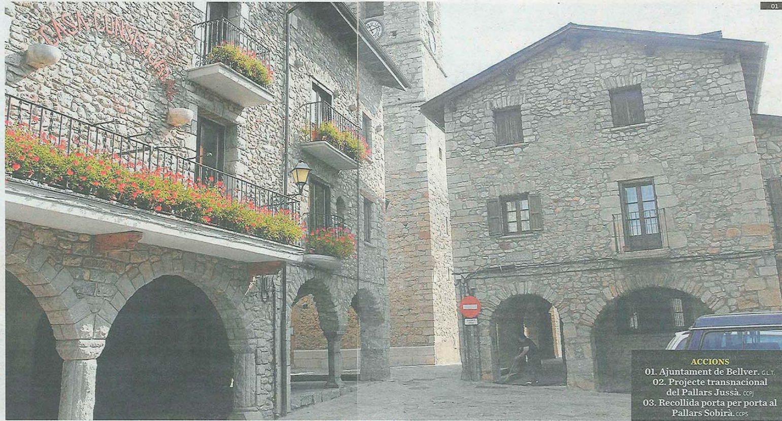
ACCIONS 01. Ajuntament de Bellver. GLT 02. Projecte transnacional del Pallars Jussà. CCPJ 03. Recollida porta per porta al Pallars Sobirà. CCPS

Singularitat La tasca dels consells comarcals pren més sentit al Pirineu